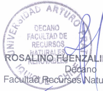
ROSALINO FUENZALIDA FUENZALIDA Decano Facultad Recursos Naturales Renovables