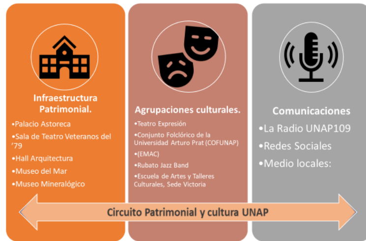
Ilustración 1: Circuito Patrimonial y Cultural

Por lo tanto, la propuesta busca consolidar el modelo de vinculación propuesto por el Circuito Patrimonial y cultural, que nace de como para de una iniciativa ADAIN el año 2020, y dar continuidad a las actividades de arte y cultura propuesta en el plan de trabajo anual, donde el objetivo general propuesto es “Fortalecimiento y consolidación del cuito patrimonial y cultural, como parte de las acciones de implementación de la nueva política de vinculación y los entornos significados declarados por la institución.” Como estrategia principal de la propuesta es mantener el vínculo y la presencia nivel regional de las actividades artísticas culturales de la universidad, además de fortalecer los vínculos con los aliados interno y externo.