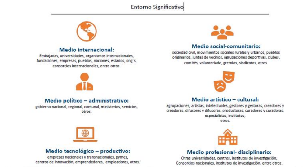
Ilustración 2: Entornos Significativos

Dentro de la política de Vinculación con el medio se identifican seis entornos significados, de los cuales la propuesta tributa al entorno Medio Artístico- cultural, cuya política específica establece: Política de extensión artística y cultural: Tiene por objeto promover la co-creación, conservación y difusión del arte, el rescate de la cultura originaria, tradicional y universal, y del patrimonio local, así como el diálogo constante con los núcleos artísticos y culturales presentes en el territorio.